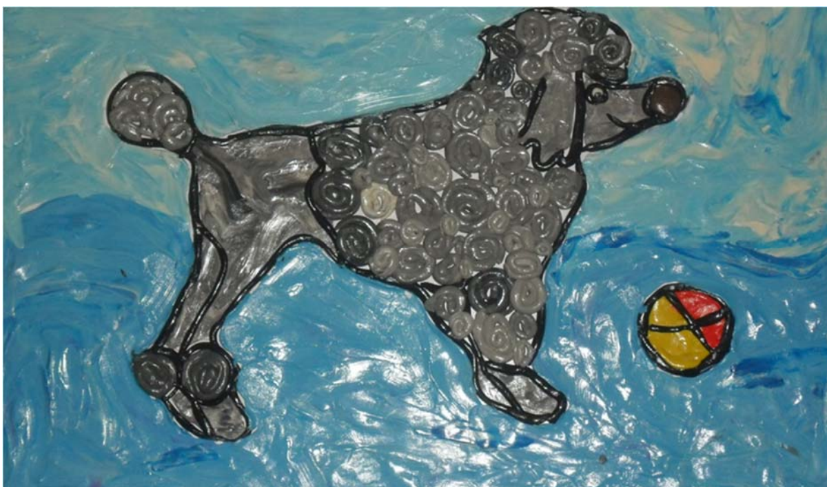
Фёдорова С. «Мой друг пудель»